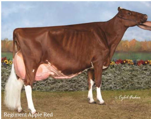
Regiment Apple Red