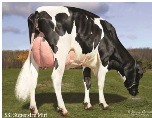
SSI Supersire Miri