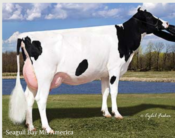
Seagull Bay Mis America